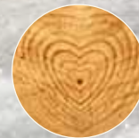
Die fünf Elemente: Feuer, Erde, Metall, Wasser und Holz